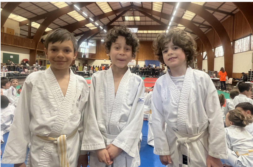
Les mini poussins