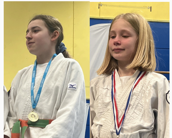
Les benjamins et minimes