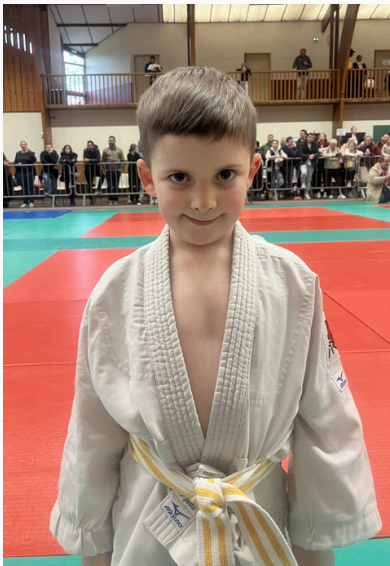
Les baby poussins